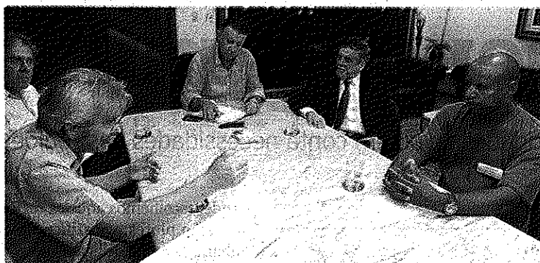
Secretário (de terno) prometeu apoio e líderes decidiram ficar com a escola