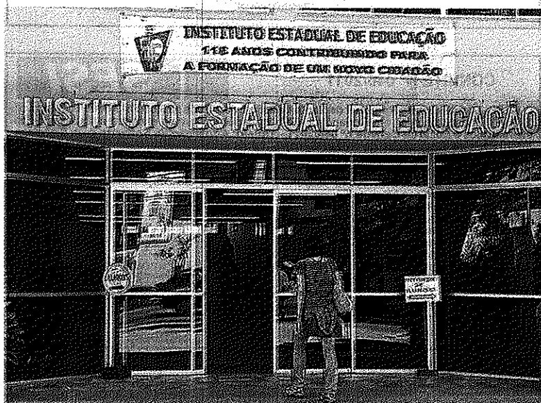
Diretor diz que Instituto tem projeto de proteção que reduziu violência

– Acho muito estranho o que aconteceu, porque os pais nunca nos procuraram falando desta situação. Mesmo assim, conversei com a Guarda Municipal e também com a Polícia Militar, pedindo que tomem mais cuidado no entorno do colégio, tanto na Avenida Mauro Ramos quanto na