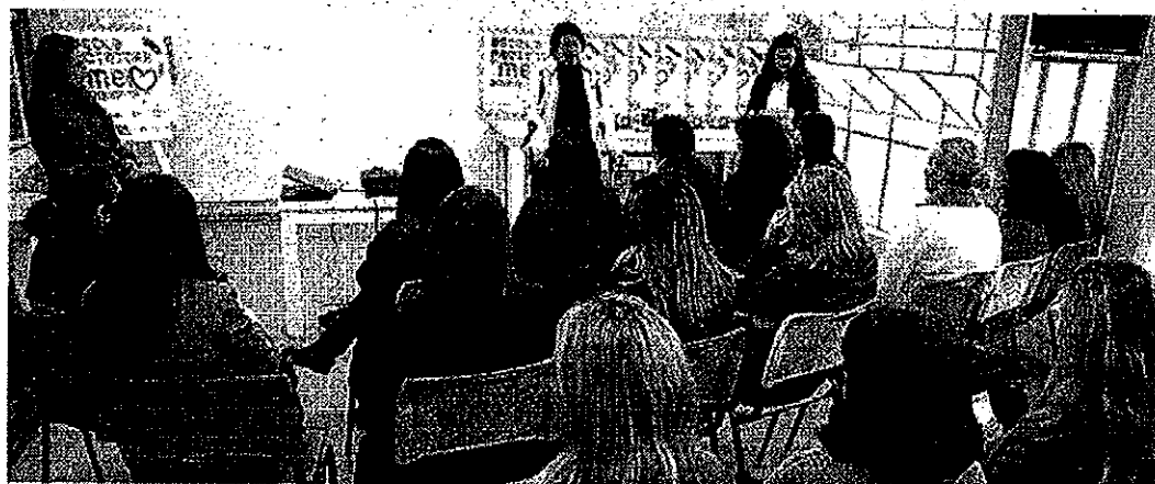
Escolas que fizeram ações ambientais receberam selo e as que continuam participando levaram troféu

Como uma forma de agradecimento às escolas envolvidas nas ações ambientais, o instituto concedeu uma viagem de estudos aos professores coordenadores para Florianópolis. "Eles vão