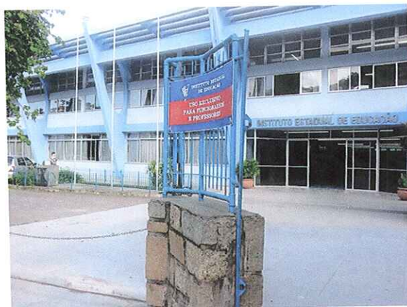
Instituto Estadual de Educação, em Florianópolis, não teve aulas nesta terça

Movimento pede adequação do piso salarial, jornada de trabalho e carreira. Paralisação iniciou nesta terça-feira (23) e adere a um movimento nacional.